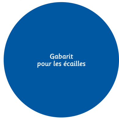
Gabarit pour les écailles